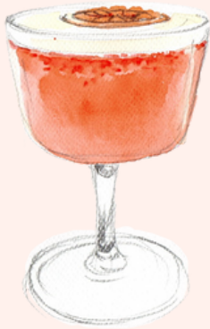
U MAZZERU 16€