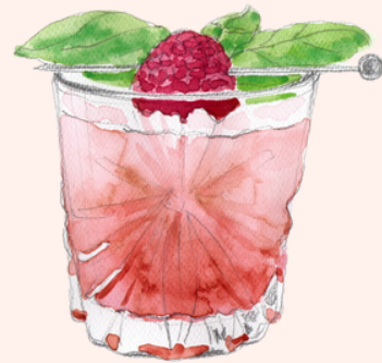
SMASH 'N CAP 16€