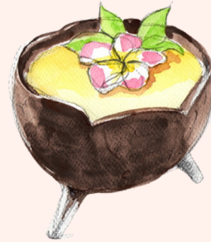
L'ÎLE DES DIEUX (frozen) 15,50€