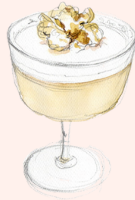
POP 'N CORN 14,50€