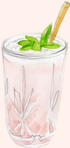
DOLCE VITA 16€