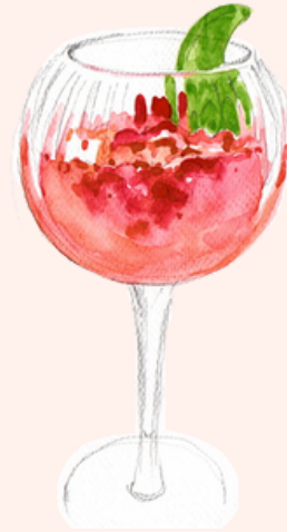
CAP MON AMOUR 14,50€